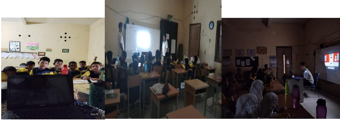
Gambar 2,3. Penyuluhan Edukasi Pemanfaatan Vitamin Pada Anak Sekolah Dasar